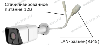
Рис. 1 Схема подключения видеокамеры