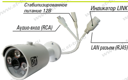
Рис. 1 Схема подключения видеокамеры